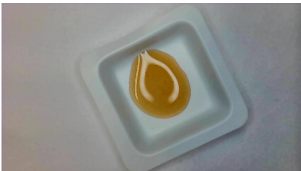
Bild der eingelangten Probe vom 17.11.2021